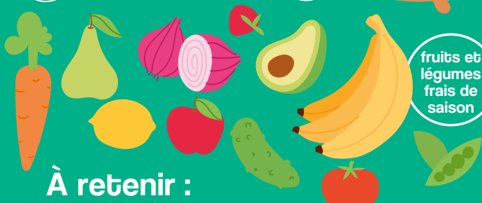
fruits et légumes frais de saison